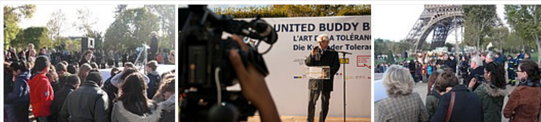
Fotostrecke (18 Bilder) starten. Klicken Sie auf ein Bild.