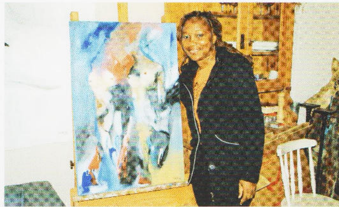
Figurale abstrakte Malerei der Künstlerin.