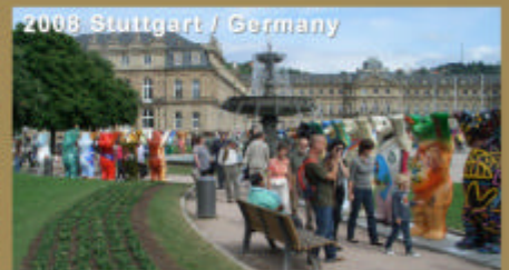
2008 Stuttgart / Germany