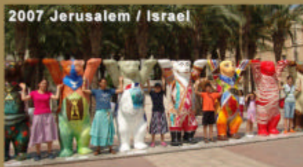
2007 Jerusalem / Israel