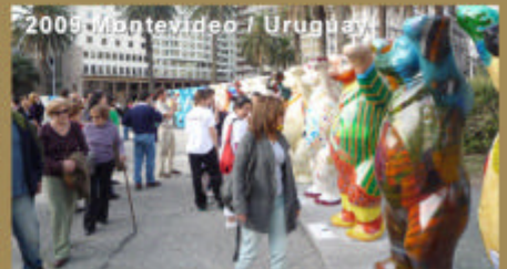
2009 Montevideo / Uruguay