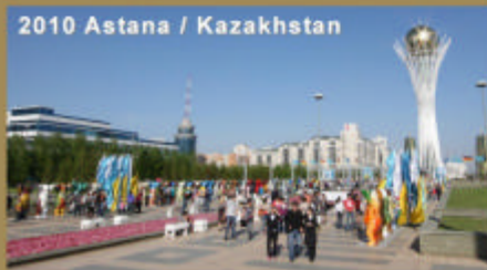
2010 Astana / Kazakhstan