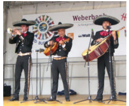
Foto: (v.l.n.r.) P. Bayogar and the Zoukoe Bays (Zentralafrika), Dazaa-Dazaa (Nigeria), Mariachi Internacional El Dorado (Mexiko)