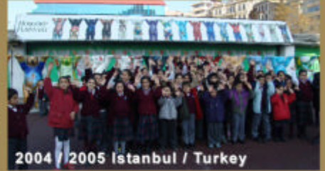
2004 / 2005 Istanbul / Turkey