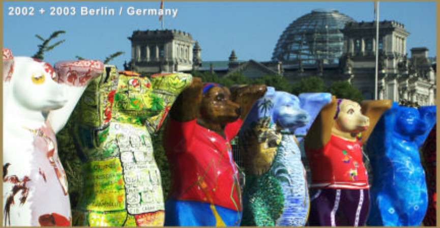
2002 + 2003 Berlin / Germany