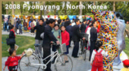
2008 Pyongyang / North Korea