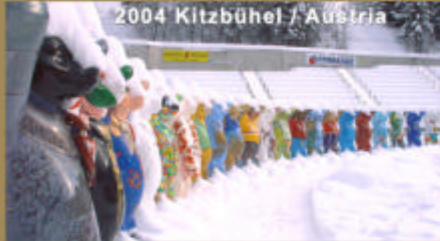
2004 Kitzbühel / Austria