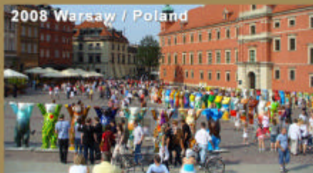
2008 Warsaw / Poland