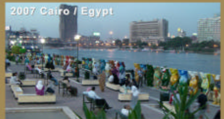
2007 Cairo / Egypt