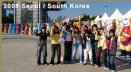
2005 Seoul / South Korea