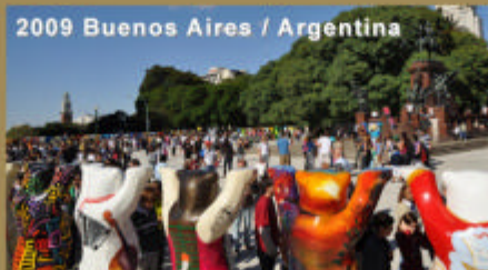
2009 Buenos Aires / Argentina