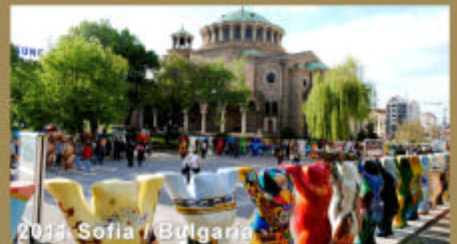
2011 Sofia / Bulgaria

United Buddy Bears Worldtour sponsored by: