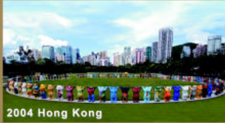
2004 Hong Kong