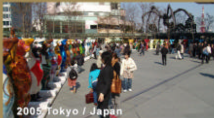
2005 Tokyo / Japan