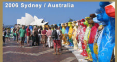
2006 Sydney / Australia