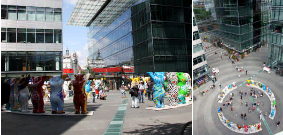
Bilder: Im Neuen Kranzler Eck am Kudamm stehen 27 europäische United Buddy Bears.

Sonderausstellung der United Buddy Bears in Berlin - vom 20. Juli – 04. September 2009 im Neuen Kranzler Eck -