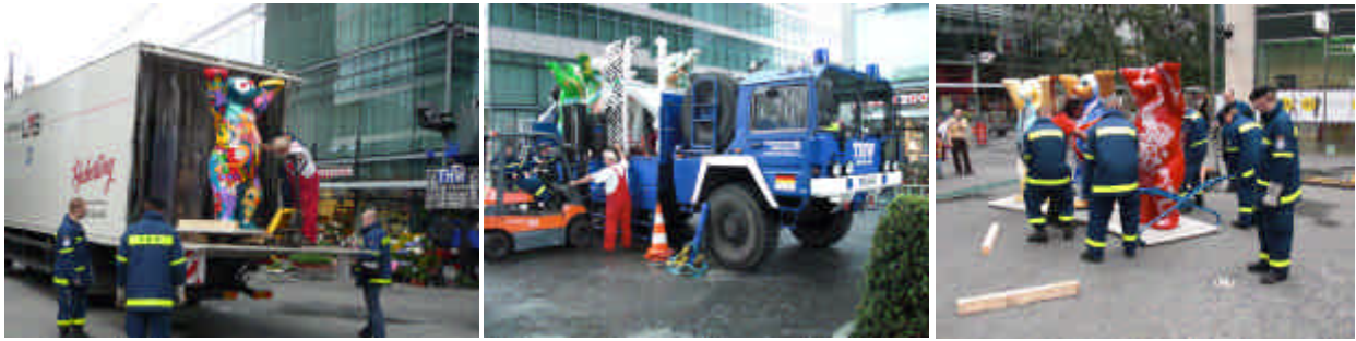
Bild links: Die Spedition Haberling transportierte die Bären der Europa-Ausstellung ins Neue Kranzler Eck. Bild mittig: Das Technische Hilfswerk rückte mit einem starken Aufbauteam und Mannschaftswagen an. Bild rechts: Mit Hilfe von Stahlzangen und viel Muskelkraft werden die Bären genau im Kreis positioniert.

Der Aufbau der überlebensgroßen Bären mit ihren rund 140 kg schweren Betonplatten ist bei jeder Ausstellung eine große logistische und organisatorische Leistung. Umso wichtiger ist es, ein tolles Aufbauteam an seiner Seite zu haben. Im Neuen Kranzler Eck hatten wir die Unterstützung des Technischen Hilfswerks, Ortsverband Reinickendorf und der Spedition Haberling.